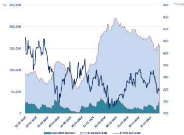
FIGURA 3: RELACIÓN ENTRE INVENTARIOS Y PRECIO DEL COBRE