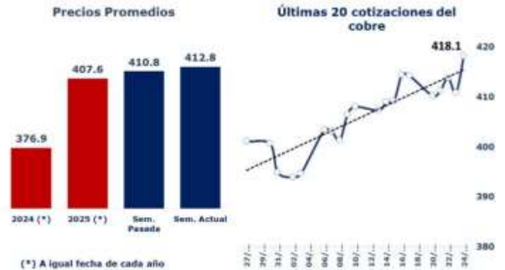
TABLA 1: PRINCIPALES PARÁMETROS DEL MERCADO DEL COBRE