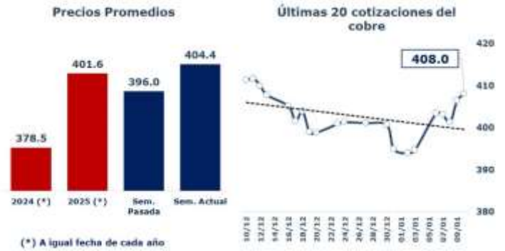
TABLA 1: PRINCIPALES PARÁMETROS DEL MERCADO DEL COBRE