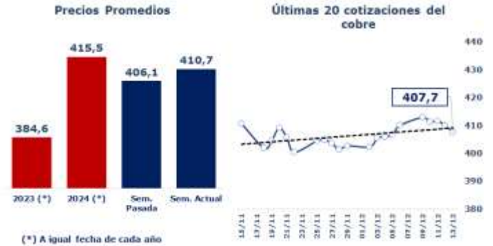
TABLA 1: PRINCIPALES PARÁMETROS DEL MERCADO DEL COBRE