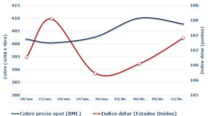
FIGURA 2: RELACIÓN PRECIO DEL COBRE E ÍNDICE DÓLAR