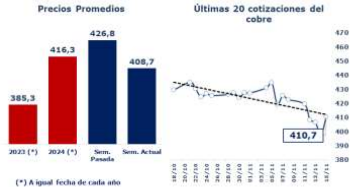
TABLA 1: PRINCIPALES PARÁMETROS DEL MERCADO DEL COBRE