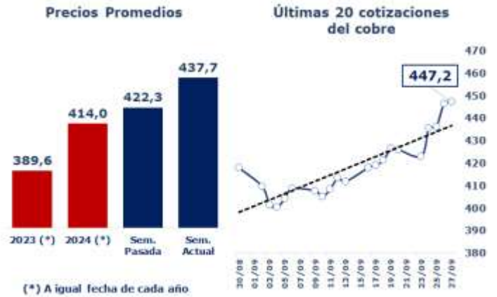
TABLA 1: PRINCIPALES PARÁMETROS DEL MERCADO DEL COBRE