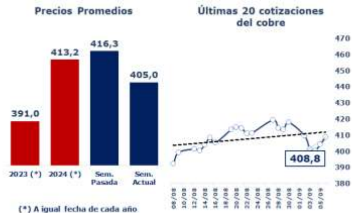
TABLA 1: PRINCIPALES PARÁMETROS DEL MERCADO DEL COBRE